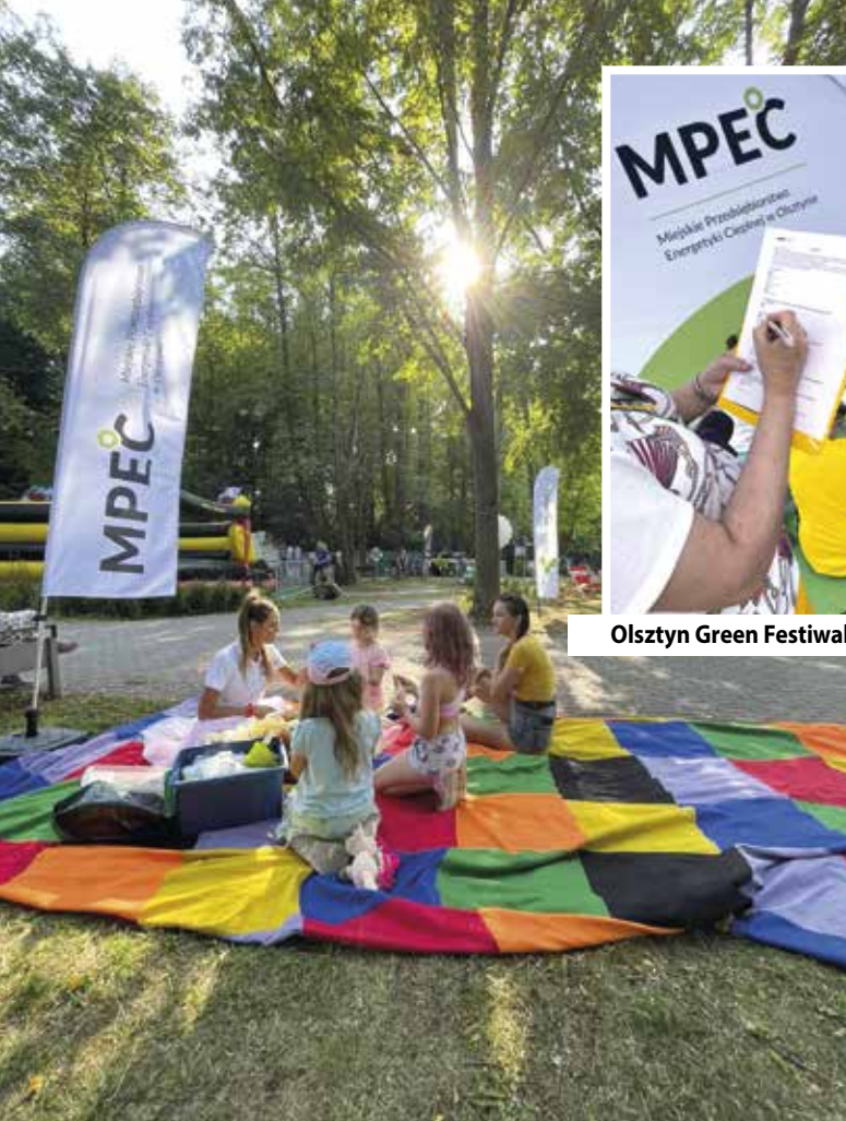
Olsztyn Green Festival – sierpień 2023