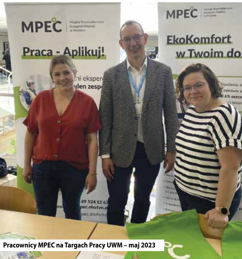
Pracownicy MPEC na Targach Pracy UWM – maj 2023