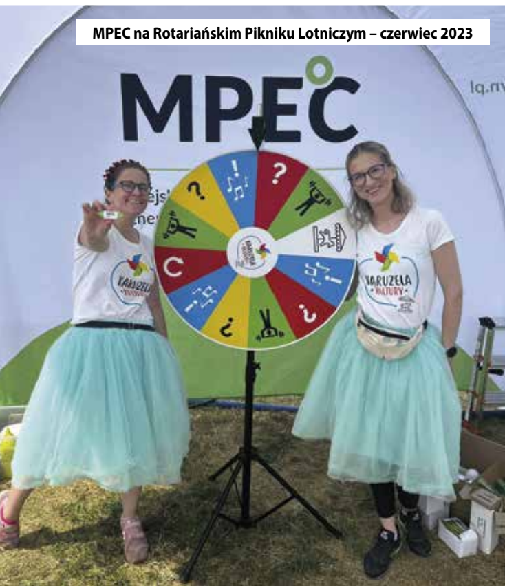
MPEC na Rotariańskim Pikniku Lotniczym – czerwiec 2023