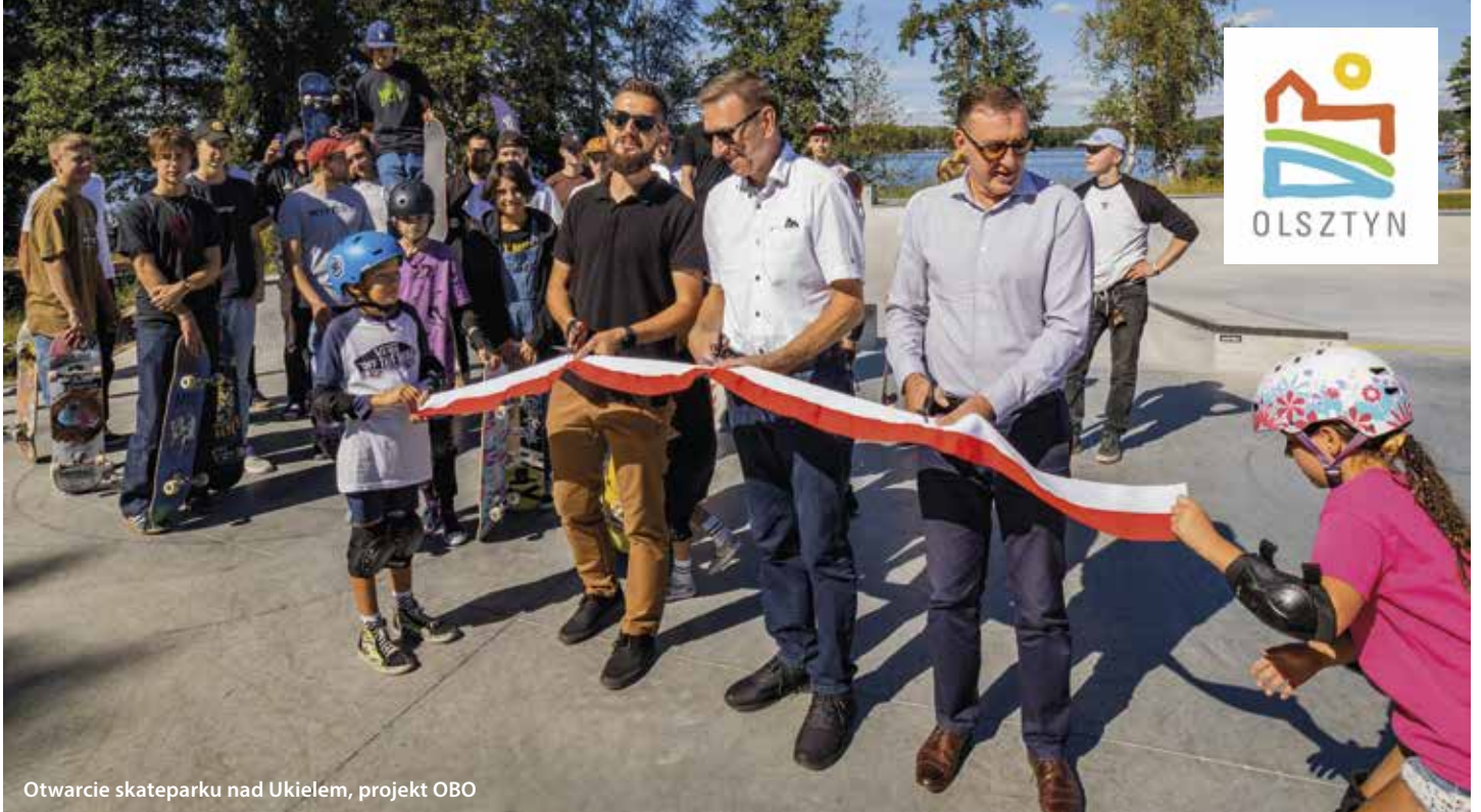
Otwarcie skateparku nad Ukielem, projekt OBO

pozostawić procedurę bez zmian. Przez 10 Lat próbowaliśmy różnych rozwiązań i można śmiało powiedzieć, że mamy solidne podwaliny. Na jubileuszową edycję wydaliśmy instrukcję obsługi pod hasłem: Wymyśl swoje miasto, która zawiera opis wszystkich etapów i pokazuje, jak możemy w OBO uczestniczyć. Przygotowując ten poradnik zdaliśmy sobie sprawę z tego, że OBO to przede wszystkim ludzie – mieszkańcy, z którymi zbudowaliśmy aktywną, kreatywną i zaangażowaną społeczność.