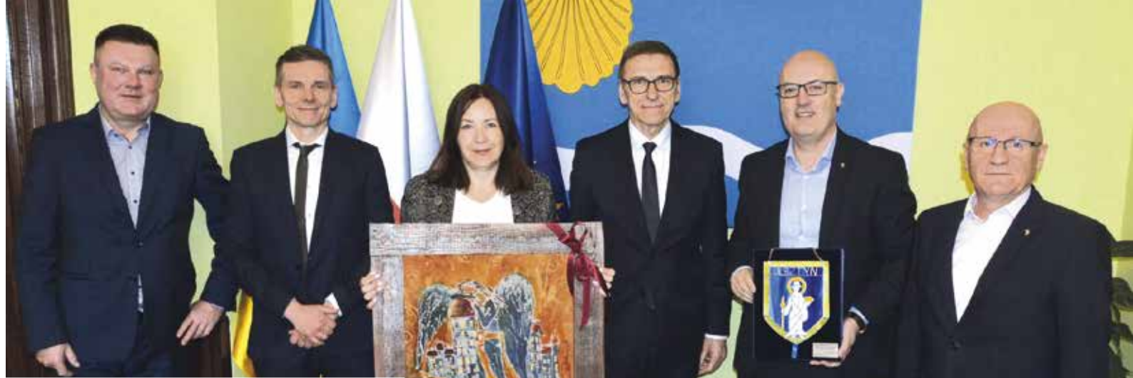
Zakończenie współpracy Spółki Michelin Polska z Miastem Olsztyn oraz MPEC Olsztyn – kwiecień 2023