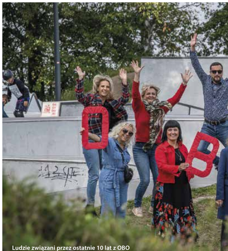
Ludzie związani przez ostatnie 10 lat z OBO

którym możemy przeprowadzić wybór projektów sprawiedliwie i w sposób transparentny. Krótka rzecz ujmując – to mieszkańcy zgłaszają projekty, mieszkańcy uczestniczą w ich ocenie i mieszkańcy głosują. Na koniec mieszkańcy oceniają, czy proces zdał egzamin, czy trzeba wprowadzić jakieś zmiany, czy jednak