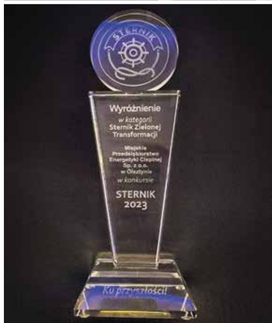
Wyróżnienie dla MPEC Olsztyn w finale konkursu BGK Sernik 2023 w kategorii Sernik Zielonej Transformacji – wrzesień 2023